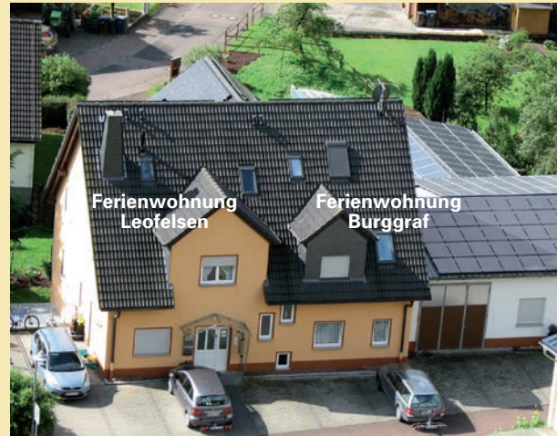
Ferienwohnung Leofelsen oder Burggraf (ca. 53 qm)