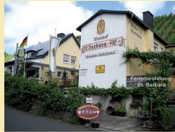
Ferienwohnung St. Barbara (ca. 73 qm)