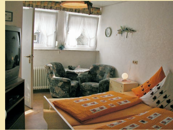
Unsere behaglich eingerichteten Gästezimmer