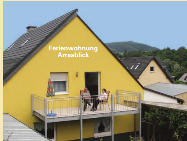
Ferienwohnung Arrasblick (ca. 51 qm)