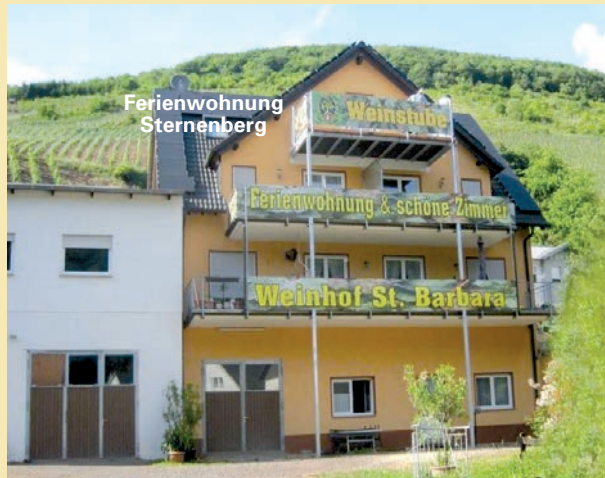
Ferienwohnung Sternenberg (ca. 52 qm)